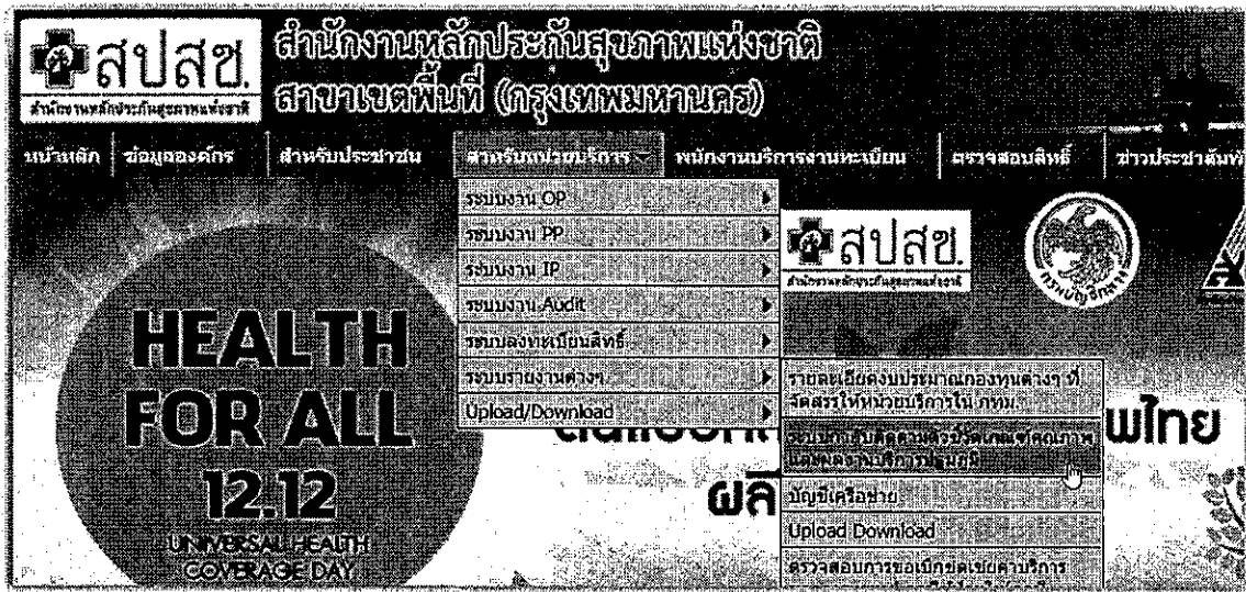
หน้าจอ ระบบกำกับติดตามตัวชี้วัดเกณฑ์คุณภาพและผลงานบริการปฐมภูมิ

เข้าสู่เว็บไซต์ http://bkk.nhso.go.th/ → สำหรับหน่วยบริการ → ระบบรายงานต่างๆ → ระบบกำกับ ติดตามตัวชี้วัดเกณฑ์คุณภาพและผลงานบริการปฐมภูมิ